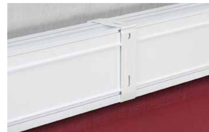
► Clip di montaggio soffitto/parete

Il nuovo cassonetto tondo per Rullo Vedo non Vedo viene prodotto in due diverse dimensioni, per poter realizzare l'impianto con proporzi sempre adeguate, fino ad una larghezza massima di 240 cm. Il profilo offre la possibilita' di montaggio a parete o a soffitto; permettendo di agganciare le clip di fissaggio in ogni punto del profilo.