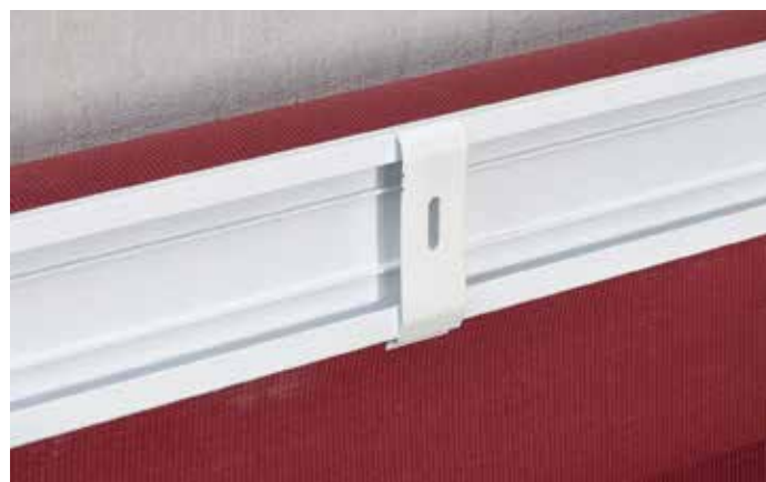
► Clip di montaggio