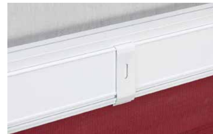
► Clip di montaggio soffitto/parete